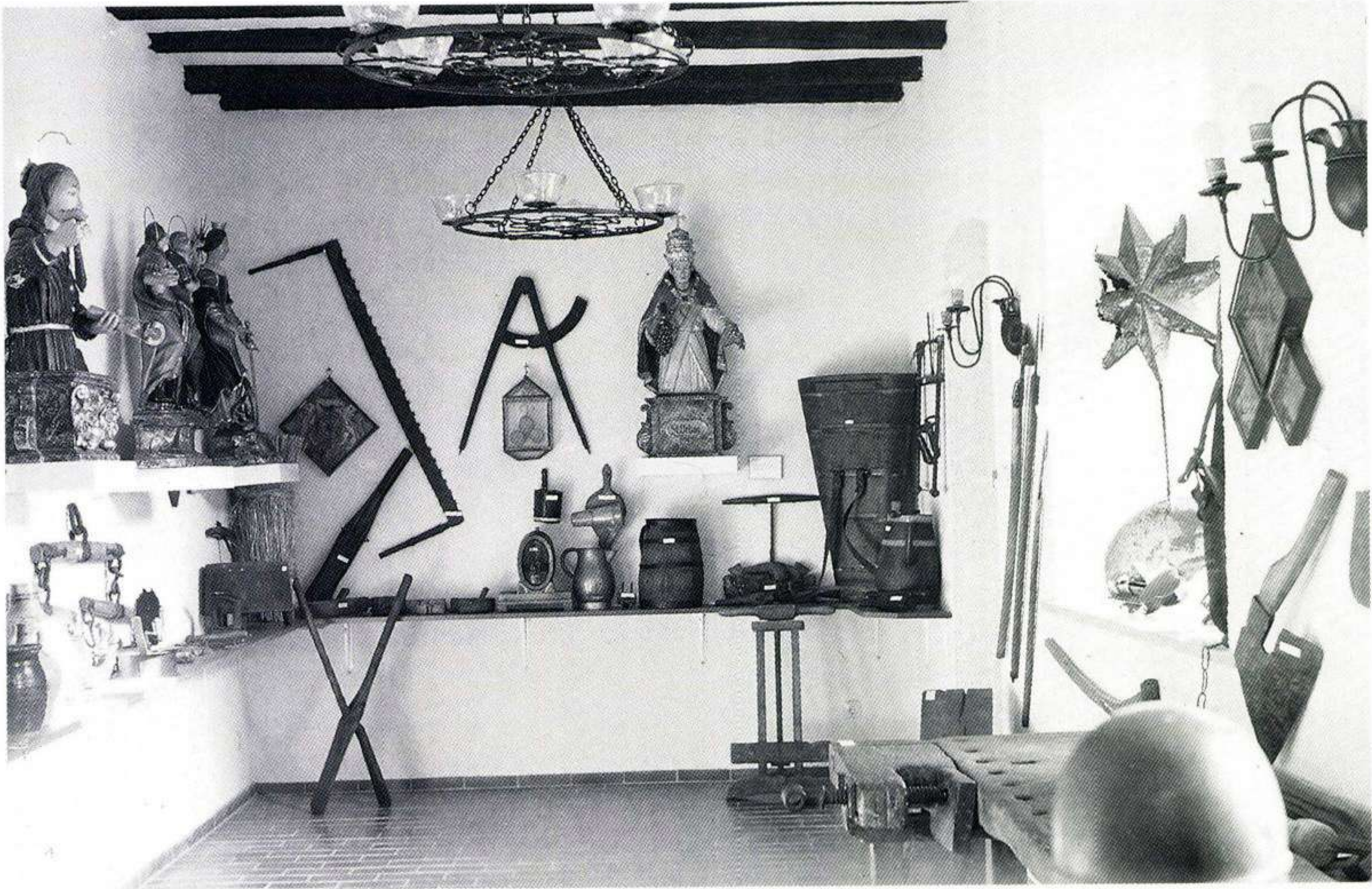
185 Kaiserstühler Heimatmuseum: Handwerk und Zünfte