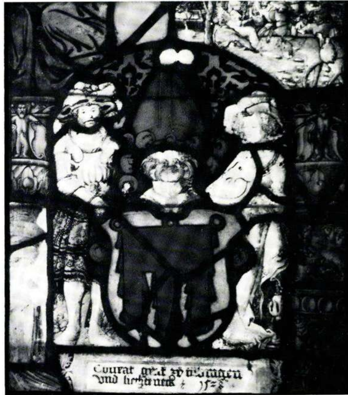
177 Cunrat graf ze Tübingen und Lichteneck, 1528