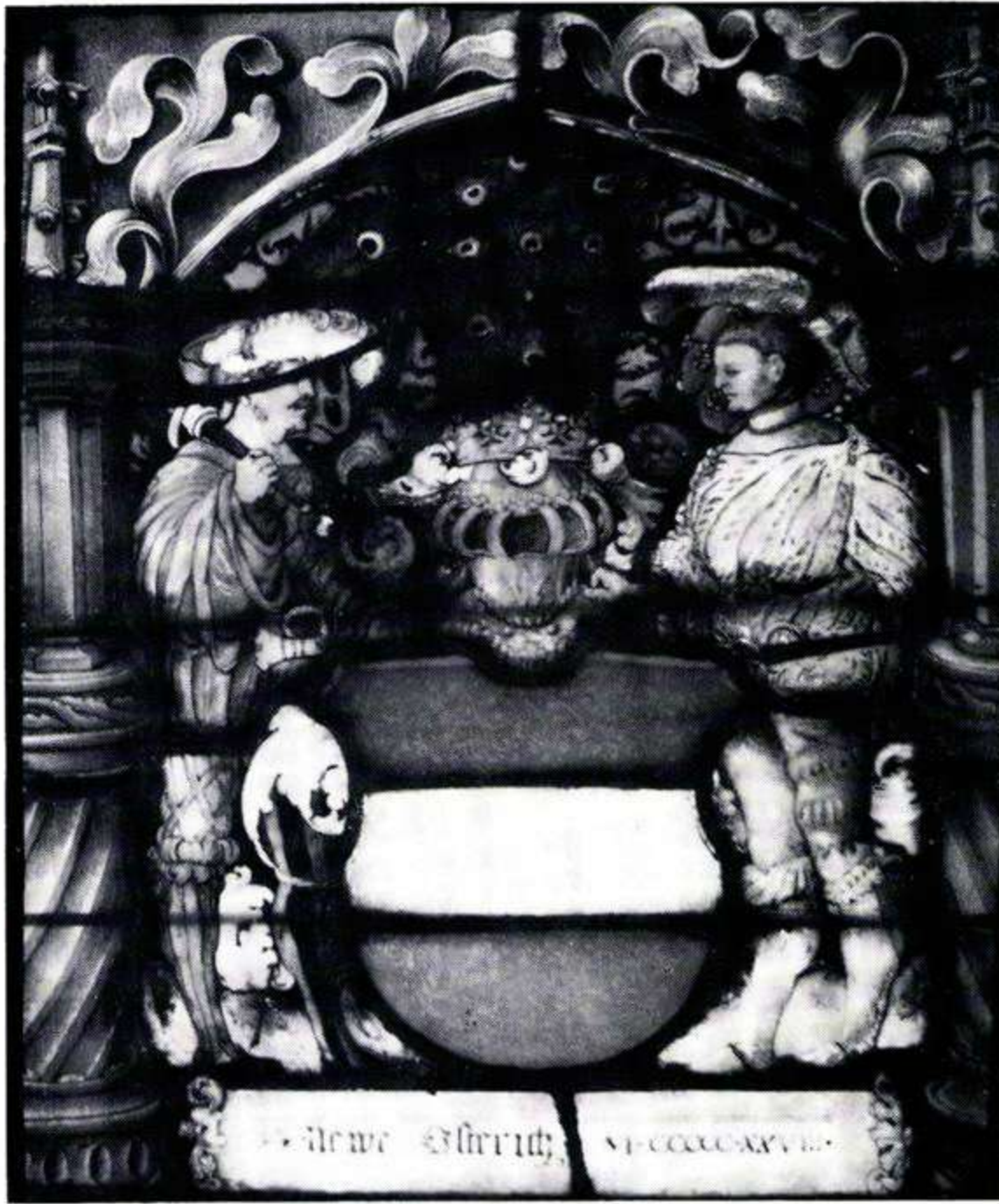
176 Neue Österich, 1528