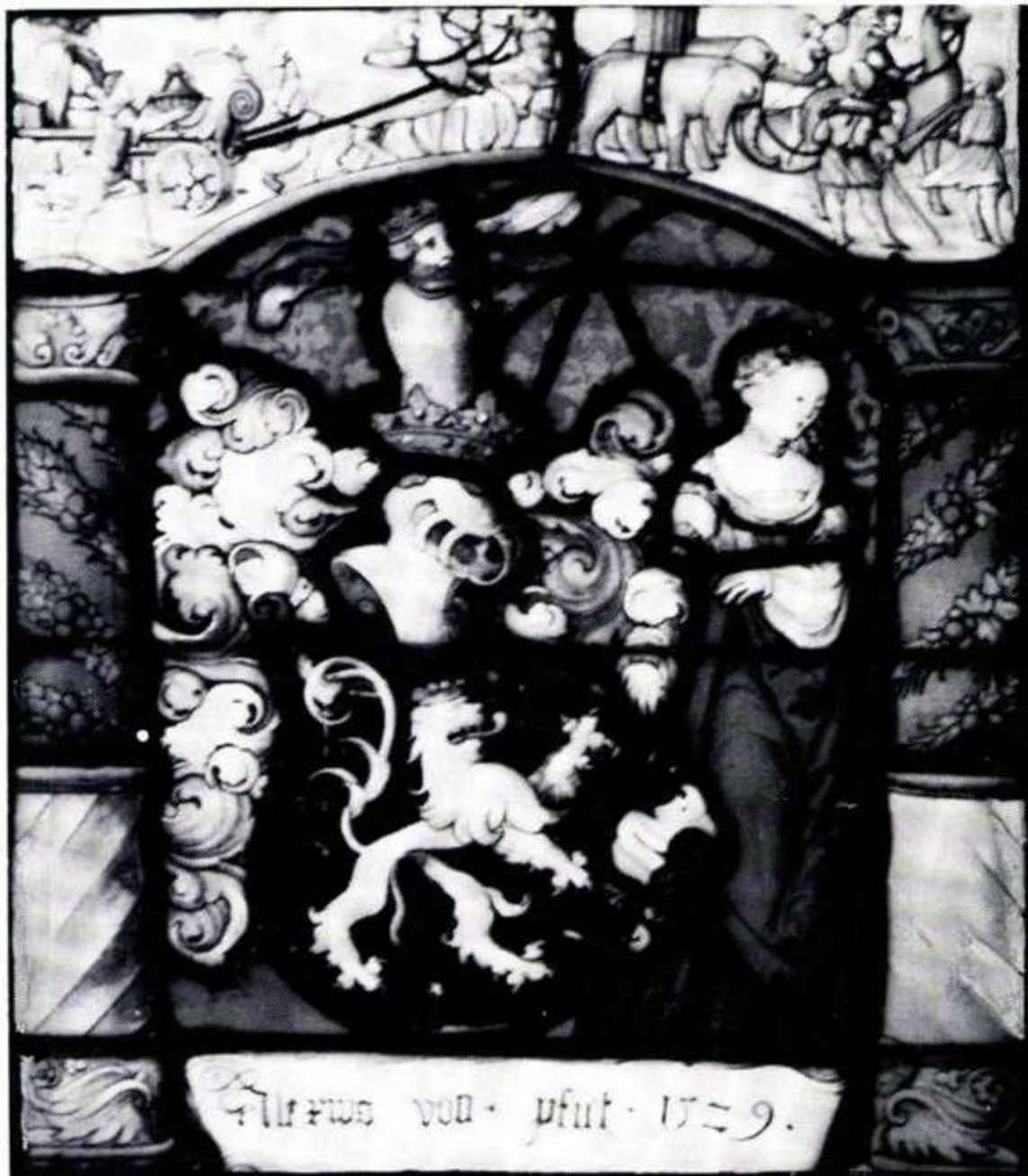
178 Alexius von Pfirt, 1529