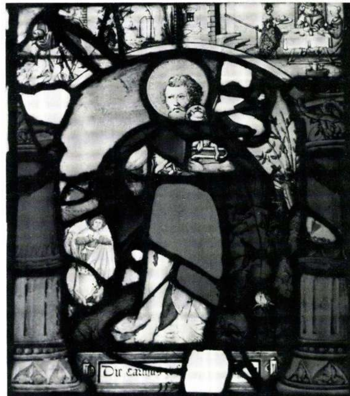
183 Die Carthus zu Freiburg, 1529