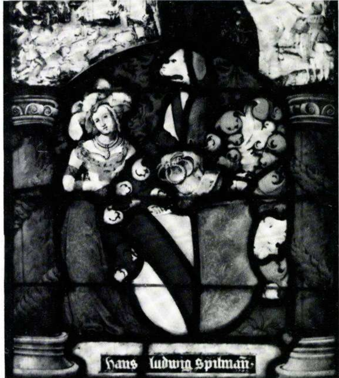
181 Hans Ludwig Spilmann, 1529