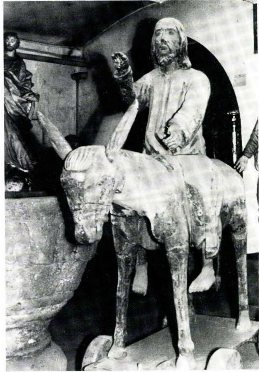
187 Kaiserstühler Heimatmuseum: Endinger Palmesel aus dem 15. Jh.