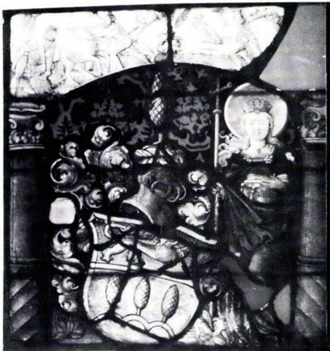
182 Margarethen zu Waldkirch