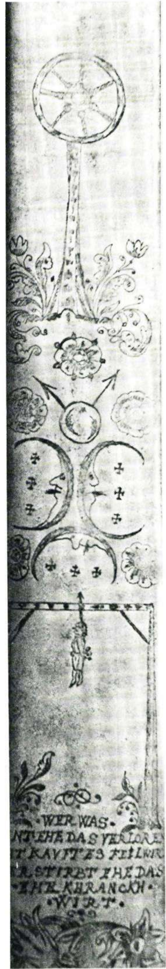
188 Kaiserstühler Heimatmuseum: Endinger Richtschwert von 1650