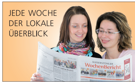
JEDE WOCHE DER LOKALE ÜBERBLICK

Am Donnerstag, 11.04., wird von 13 bis 17 Uhr eine kostenlose Fortbildung im Landwirtschaftlichen Bildungszentrum Emmendingen-Hochburg, Hochburg 7, in 79312 Emmendingen im Raum 009 stattfinden. Inhaltlich richtet sich die Veranstaltung an Zierpflanzengärtnerinnen. Es wird eine Bewirtungspauschale von 5,50 Euro/Teilnehmer erhoben. Anmeldungen sind bis 04.04. möglich unter www.lkbh.de/landwirtschaft oder bei Fr. Braun, Landratsamt Schwarzwald-Baar-Kreis (Telefon: 07721 913-5323; E-Mail: Christine.Braun@lrasbk.de ). Dort gibt es auch weitere Infos.